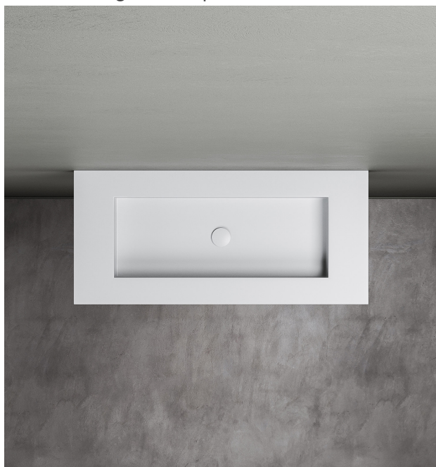
versione integrata al top H2.4

Il lavabo Kube, realizzato interamente in Corian® DuPont™, è caratterizzato da pareti interne squadrate e fondo termoformato con pendenza verso lo scarico. La piletta ispezionabile di forma circolare è dotata di copri piletta in finitura Corian® in tinta. Questo modello è disponibile in due versioni: integrato al top o installato in appoggio, in mono o bicolore tra top e lavabo. Il lavabo Kube può essere realizzato anche in dimensioni personalizzate. Il lavabo Kube può essere completato dal vassoio slide